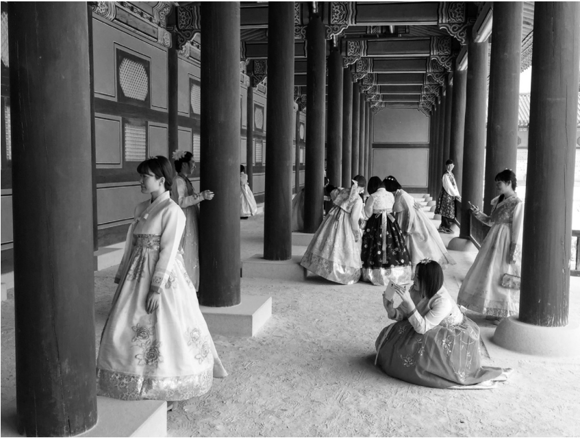
Jongeren gekleed in traditionele hanbok maken foto's in Gyeongbokgung, Seoel, 2004.

stukje film kijken, om even alleen te zijn, maar ook, en dat is wel belangrijk, om een dutje van tien minuten te doen.